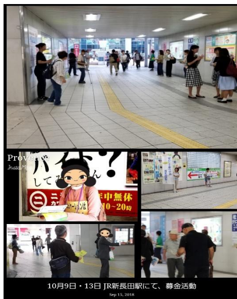
10月9日・13日 JR新長田駅にて、募金活動 Sep 15, 2018

「いつもご苦労さん」「前もやってたね」などと声をかけられることも増え、少しずつ認知度が広がっていることを感じます。